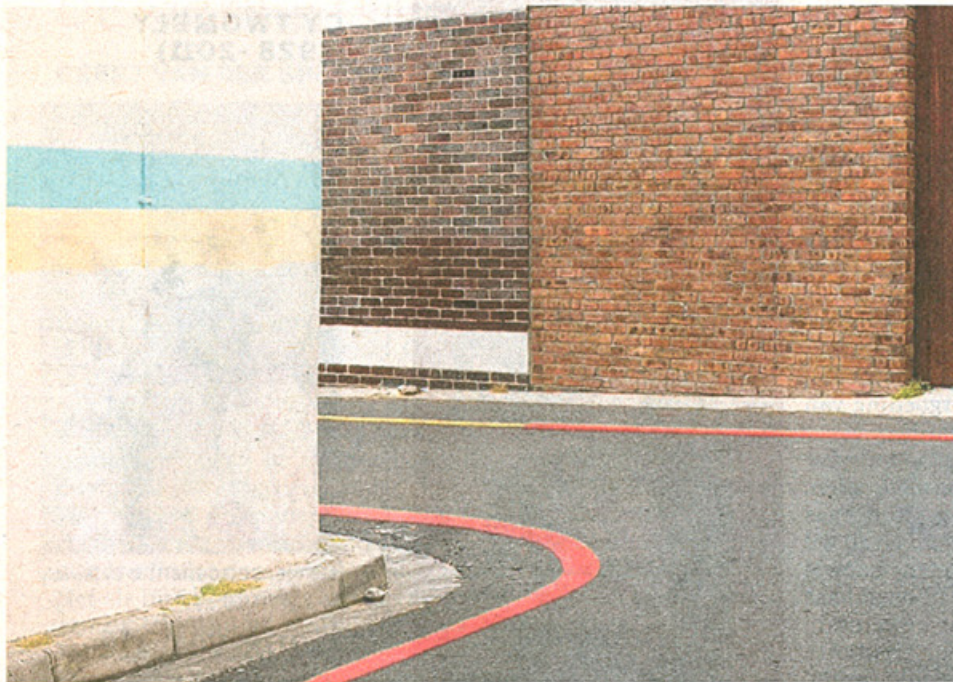
'Simple present #199, (Cape Town)', 2008, Bert Danckaert.