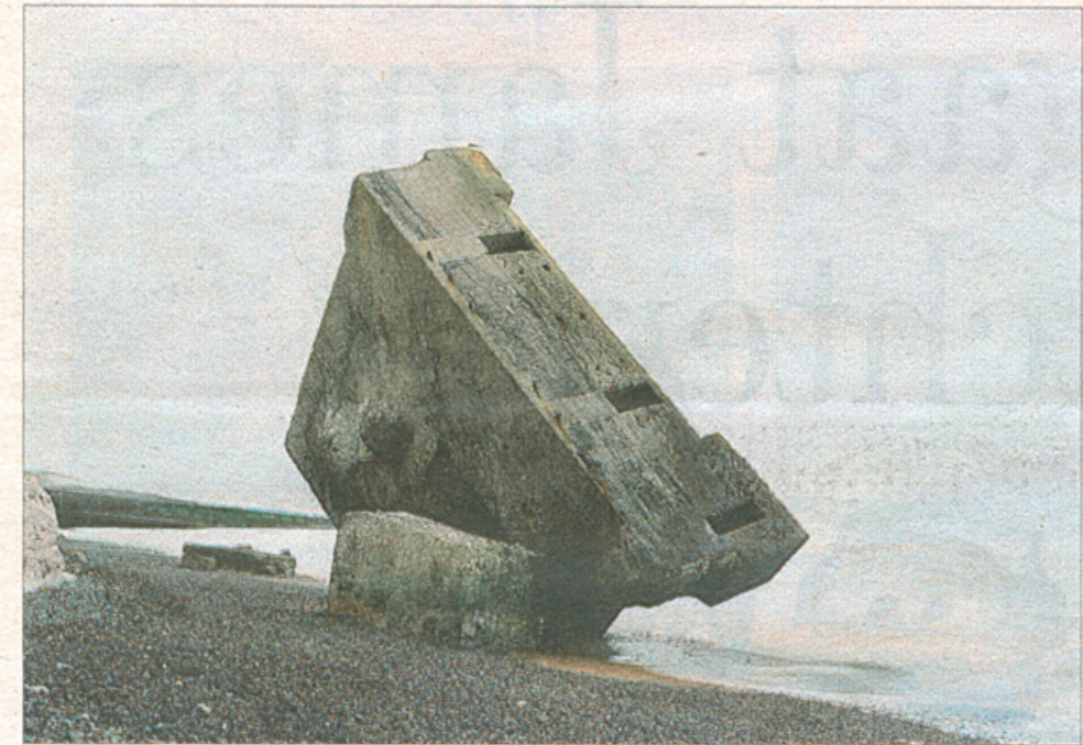
'The bunker #1', 2010, Jan Kempenaers. © Jan Kempenaers